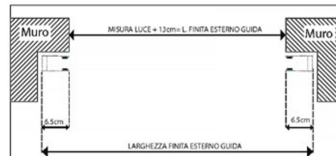
LA MISURA DELLA LARGHEZZA FINITA ESTERNO GUIDA SI OTTIENE AGGIUNGENDO ALLA MISURA LUCE 13 CM.